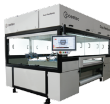
Automat lakierniczy Duo FlexSpray