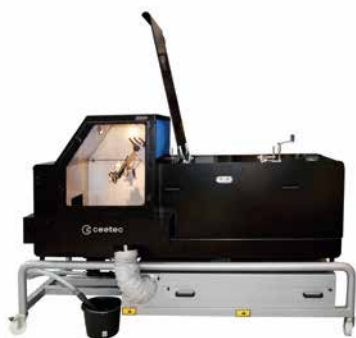
Polewarka szczotkowa IPC250