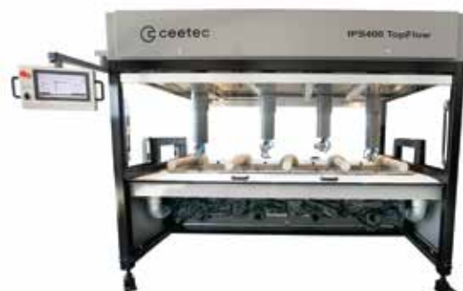
Polewarka automatyczna IPS 400