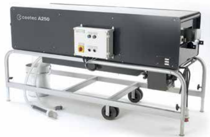
Polewarka szczotkowa A250