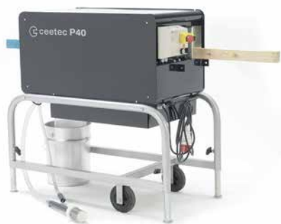
Polewarka szczotkowa P40

Firma Ceetec została założona w 1970 roku. Przez wszystkie lata Ceetec produkował maszyny dla globalnego rynku koncentrując się na prostocie i łatwej obsłudze. Dzisiaj Ceetec jest wysoko wyspecjalizowaną firmą z solidną znajomością branży. Asortyment produktów składa się z maszyn do formowania profili, szlifierek, automatów malarskich i maszyn specjalistycznych.